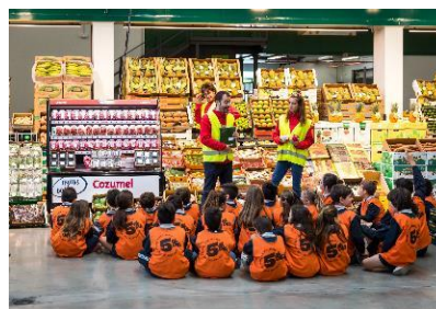
05. Espai de difusió gastronòmica