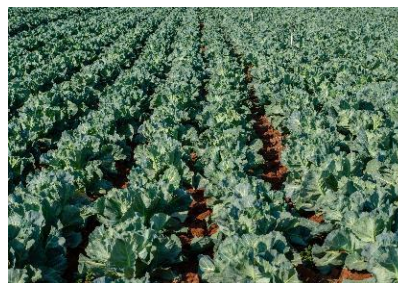
02. Punt de connexió entre el món rural i l'urbà