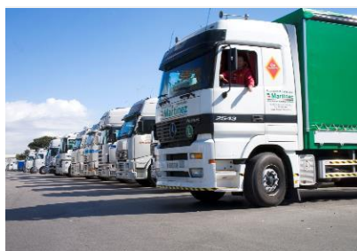
01. Pol empresarial i logístic

DE MERCAT MAJORISTA A ECOSISTEMA AGROALIMENTARI