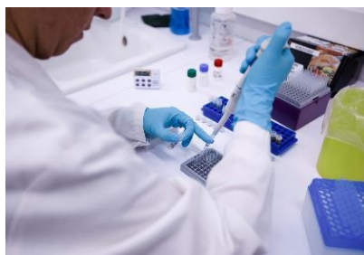
04. Centre d'innovació