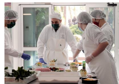
06. Campus de formació alimentària