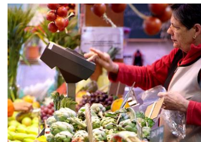
03. Dinamitzador del comerç i la restauració locals